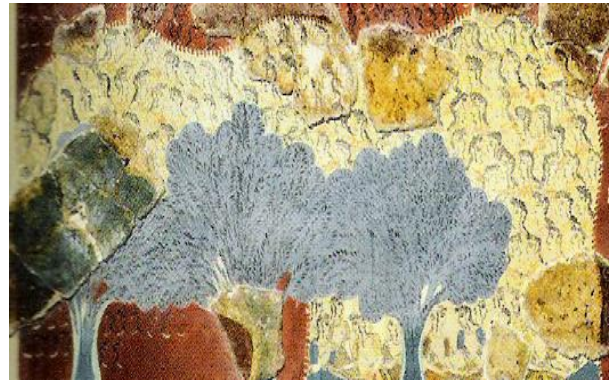
Χορός στο ιερος αλσος (ελαιων)-Κνωσός 1700 π.χ.