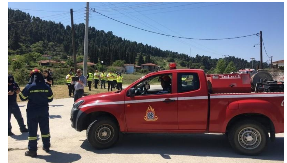
Φωτογραφικά στιγμιότυπα από τη μεγάλη άσκηση ετοιμότητας και οργανωμένης απομάκρυνσης πολιτών στην Κασσάνδρα Χαλκιδικής